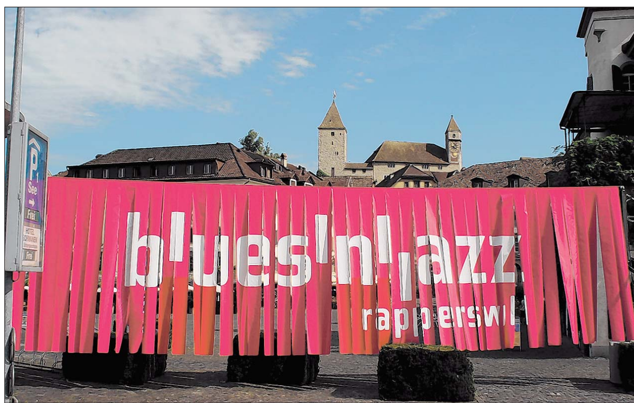
Das spektakuläre Portal vor der Schlosskulisse lädt zum dreitägigen Festival mit drei Bühnen und 33 Konzerten.

Das blues'n'jazz rapperswil hat sich längst zum überregionalen Anziehungspunkt gemausert. Spätestens mit dem riesigen Portal eingangs Altstadt dürfte dies jedem Passanten bewusst werden. Der Blickfang soll jedoch nicht davon ablenken, was im Mittelpunkt steht: 3 Tage – 3 Bühnen – 33 Konzerte.